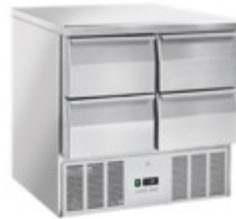
Table 2x2 tiroirs 1/2, poids 88.5Kg, classe énergétique C Dimensions L900xP700xH880 Fr. 2'490.-, net Fr. 1'850.- HT , transport Fr. 150.-