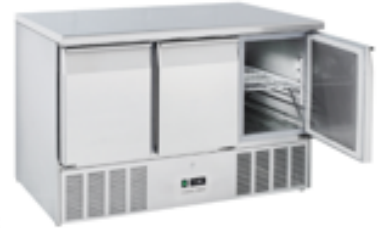
Table 3 portes, poids 95Kg, classe énergétique D Dimensions L1365xP700xH880 Fr. 1'990.-, net Fr. 1'510.- HT , transport Fr. 180.-